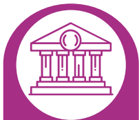
Gobierno del estado