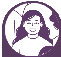
Promotora de Empoderamiento Económico